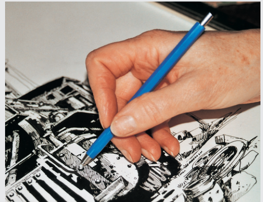
„Standard“ – Bearbeiten von Tuschezeichnungen o.ä.

Für feine Arbeiten, z.B. Reinigen und Entfernen von Tusche-/Tinte und Bleistiftstrichen auf Transparentpapier, Karton, Metall o.ä.; Einsatz: Glasfaser